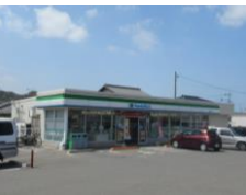
ファミリーマート